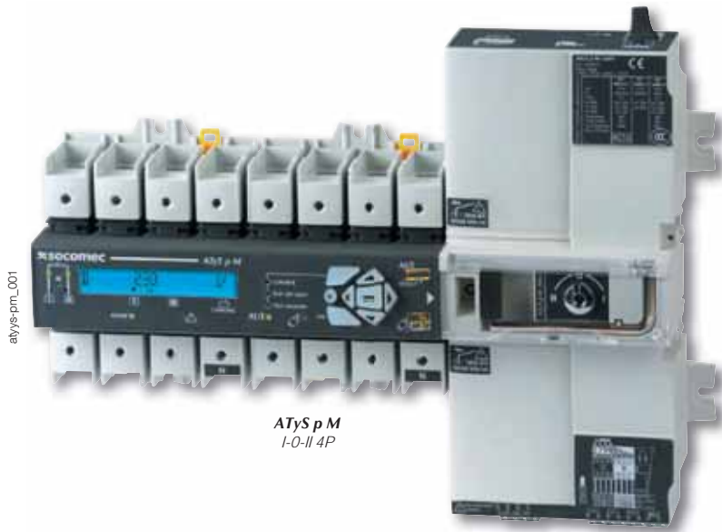
ATyS p M I-0-II 4P